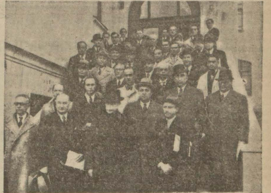
Kongre azası içti madan çıkarılarken

Ankara, 5 (Hususî) — Türk Basın Birliğinin birinci umumî kongresi yar-rın çalışmalarını tamamlayacaktır. Program ve nizamname komisyonları bu gece geç vakte kadar toplantılarına devam ederek kendilerine havale edilen işler üzerinde görüşmelerini ta-mamlamışlar ve umumî heyete arzede-lecek raporları hazırlamışlardır. Her iki encümen raporlarında umumî he-yete dikkate değer esaslar teklif et-mektedirler. Bunlardan bazıları bil-diriyoruz: