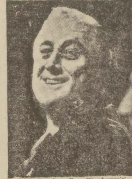
Birleşik Amerika Cümhurreisi Bay Ruzvelt

Felç hastalığı neticesinde o ayaklarına basamaz olmuştur. Ayaklarına hâkim değildir. Onlara en ufak bir hareket yaptıramaz. Ayakları üzerinde ancak bir iki dakika durabilmektedir. Ayaklarını oynatabilmek için dizlerine birer alet taktırmıştır. Dizlerinden mekanizmalı olan bu alet bir kayışla beline bağlı bulunmaktadır. Aletin ucları kunduralara varmaktadır. Ruzvelt ayağa kalkmak veya yürümek istediği vakit, ayaklarını öne doğru u-